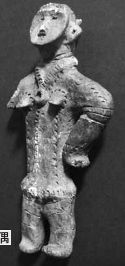
「静内御殿山墳墓群」出土の土偶 (北海道指定有形文化財)