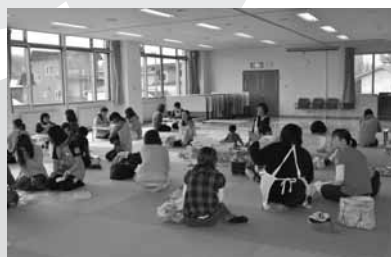
乳幼児健診の様子

【問合せ】 静内保健福祉センター ☎0146-42-1287 三石保健センター ☎0146-33-2233