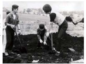
※静内高生による発掘調査

新ひだか町誕生10周年と新ひだか町博物館開館1周年を記念して、7月2日から地域文化研究に貢献した静内高校の足跡をふりかえる特別展を開催します。