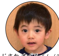
ふじさか ずぐるくん（2歳）