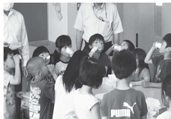
三石小学校でも7月からフッ化物洗口を開始