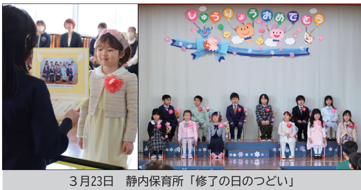
3月23日 静内保育所「修了の日のつどい」

【問合せ・申込み】新ひだか町社会福祉協議会 ☎43-3121 / FAX 43-2223