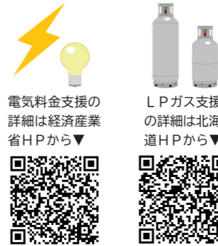
電気料金支援の詳細は経済産業省HPから▼