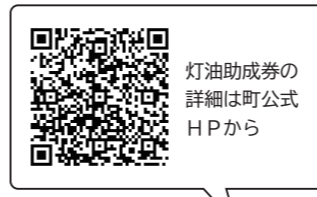
灯油助成券の詳細は町公式HPから