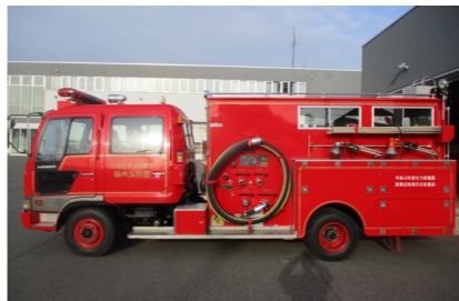
【初年度登録】平成4年12月10日 【車検満了日】令和7年12月26日 【走行距離】19,518km

売り払い車両 消防ポンプ自動車CD-II型 最低見積価格 70,000円(税別) 参加資格 ●町内に住所を有する方 ●町内に本店・支店・営業所を設置している法人・事業者 申込期限 2月5日(木) 17時00分 その他 申込方法や注意事項は、消防署窓口またはホームページでご確認ください。