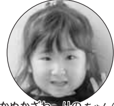
かぬかさわりのちゃん(5歳)