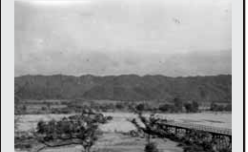
寸断された豊畑大橋

「水害の写真がもっと見たい！」との要望が多く、このたび、展示写真の一部を入れ替えました。