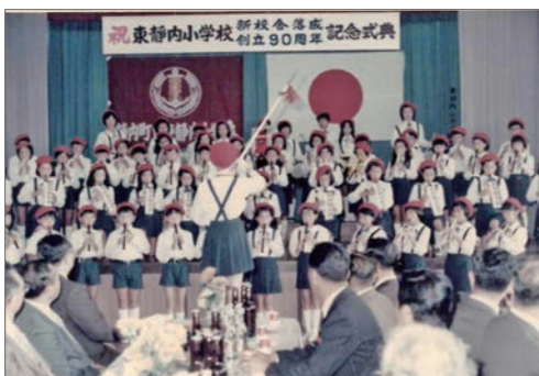
昭和50年9月9日新校舎落成・創立90周年記念式典の様子(当時は7学級208名の児童が在籍)

新型コロナウイルス感染症の感染拡大を防止するため、案内者以外の方の参加はご遠慮いただき、