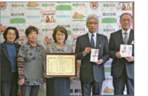
10月28日 国際ソロプチミスト静内へ感謝状贈呈