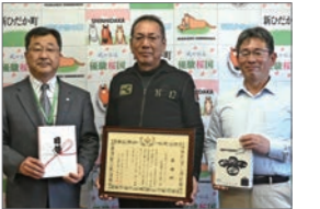
10月26日 (一社) ミルトホールディングスへ感謝状贈呈