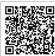
道ホームページ「オンライン婚活」QRコード

道では、自宅などからオンラインで気軽に参加できる婚活イベントを次のとおり開催します。 対象者 次のいずれかに該当する方 ①道内にお住まいの方で、今後も定住予定の方 ②北海道への移住に関心のある方 とき 10月、11月、12月の3回を予定 ※詳しい日程は、参加者の希望を踏まえ決定します。 応募方法 道ホームページからお申し込みください。