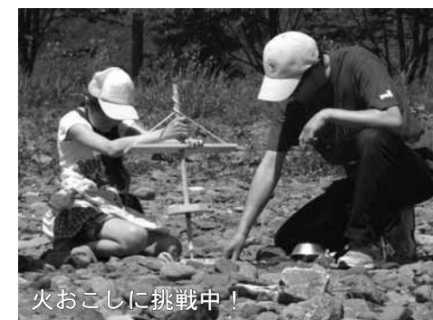
火おこしに挑戦中!

7月29日(日)、三石川河川敷で土器の野焼きを行い、11組27名の親子が参加しました。土器が焼き上がるまでの5時間の間、炭火での「ジンギスカン」の昼食をはさみ、額に汗しての「火おこし体験」や三石川のひんやりした水につかりながらの「水生生物の観察」も行い、夏の青空の下、親子で楽しい時間を過ごしました。