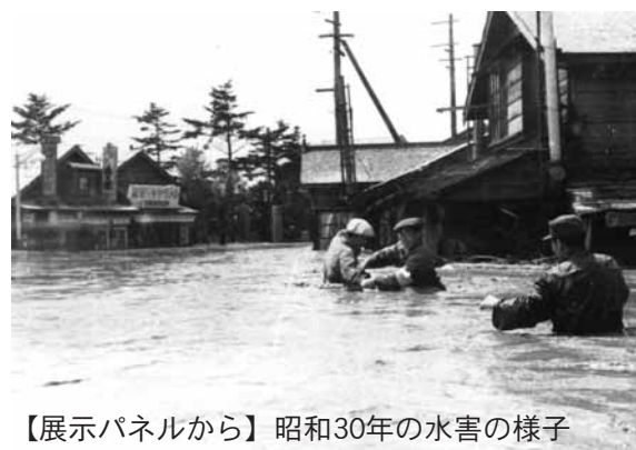
【展示パネルから】昭和30年の水害の様子