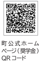
町公式ホームページ（奨学金）QRコード