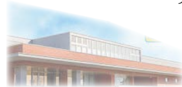
新ひだか町図書館

休館日 7月4日(月)、11日(月)、 19日(火)、25日(月)、29日(金)