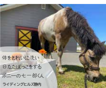
体をきれいに洗い 日なたぼっこをする ポニーのセー太郎くん ライディングヒルズ静内

● 町民子ども馬のお世話体験教室 とき 7月16日(土) 13時30分～14時30分 対象者／町内にお住まいの原則6歳以上中学3年生以下の方 定員／4人(先着順) 参加料／無料