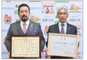
5月19日 (株)出口組へ感謝状贈呈