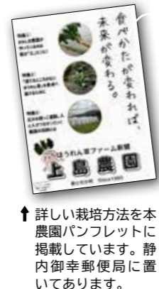
↑ 詳しい栽培方法を本に静置農園パンフレットに掲載しています。内御幸郵便局に置いてあります。

先代からホウレンソウ一筋35年。43棟のハウスで栽培し、連作障害が発生しないように時間をかけて作付けや土壌環境作りを行っています。手間暇惜みず、丁寧な作業を繰り返しながら、わずかな農薬と天然肥料だけで育て上げ、根っこまでおいしく食べられるホウレンソウを栽培しています。