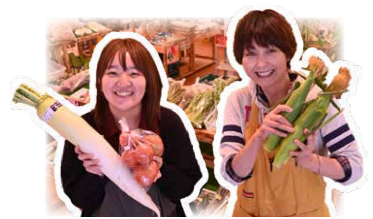
花き・野菜直売所「春那」さんのスタッフと地元で採れた野菜たち

「地元の野菜、どこで買えるの…」新鮮な地場産野菜は、農協店舗や町内の青果店、小売店などのほか、スーパーの一角などで販売されています。ここでは、農家さんが、その日の朝に収穫した新鮮な野菜を購入できる直売所をご紹介します。