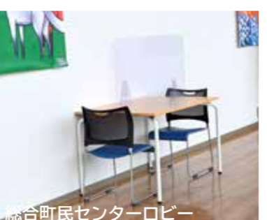
総合町民センターロビー (月)～(日) 9時00分～18時00分

【問合せ】 静内庁舎まちづくり推進課 ☎49-0294(直通) 公民館 ☎42-0075 総合町民センター ☎33-2222