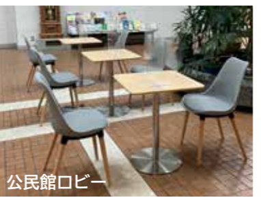
公民館ロビー (火)～(土) 9時00分～21時00分、(日)9時00分～18時00分