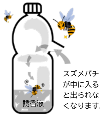
スズメバチが中に入ると出られなくなります。

静内庁舎生活環境課 ☎49-0289(直通) 三石庁舎地域振興課 ☎33-2112(直通)