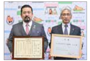
5月19日 (株)出口組へ感謝状贈呈