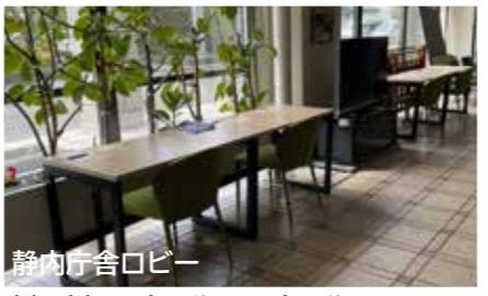
静内庁舎ロビー (月)～(金) 8時45分～17時30分