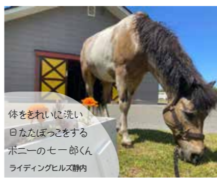
体をきれいに洗い 日なたぼっこをする ポニーのセー太郎くん ライディングヒルズ静内

● 町民乗馬体験教室 とき 7月9日(土) 10時00分～11時30分 対象者／町内にお住まいの16歳以上の乗馬初心者