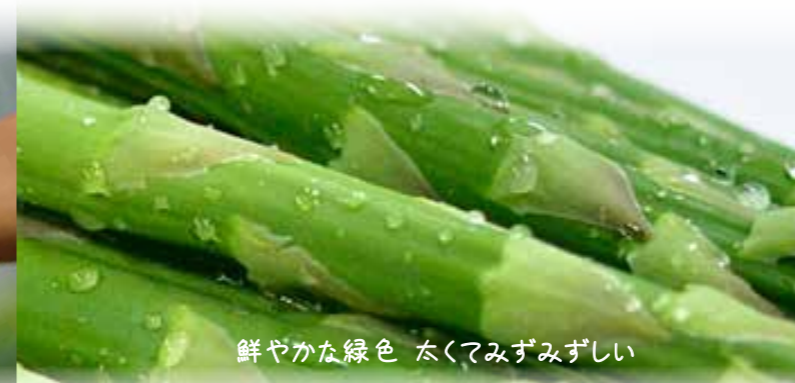
鮮やかな緑色 太くてみずみずしい