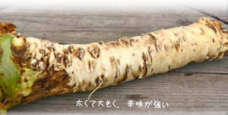
太くて大きく、辛味が強い

「今日の晩ご飯：何にしようかなあ」と考えている方がいましたら、新鮮な地元野菜をレシピに加えてみるのはいかがでしょうか。 地元の農家さんでは、ミニトマトやアスパラガスのほか、ホウレンソウやカリフラワー、キュウリなど、さまざまな野菜を栽培し、農協や卸売市場などに出荷しているほか、町内の直売所などで販売しています。 今回の特集では、地元で栽培されている野菜や、町内の直売店さんの紹介を交えながら、地元野菜の魅力について紹介します。 新鮮な地元野菜で、みずみずしく健康な体に――。