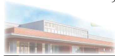
新ひだか町図書館

休館日 7月4日(月)、11日(月)、 19日(火)、25日(月)、29日(金)