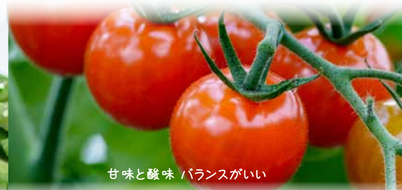
甘味と酸味 バランスがいい