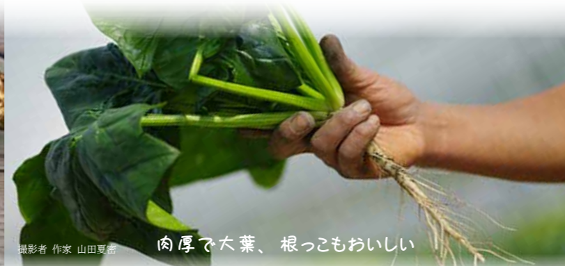
肉厚で大葉、根っこもおいしい