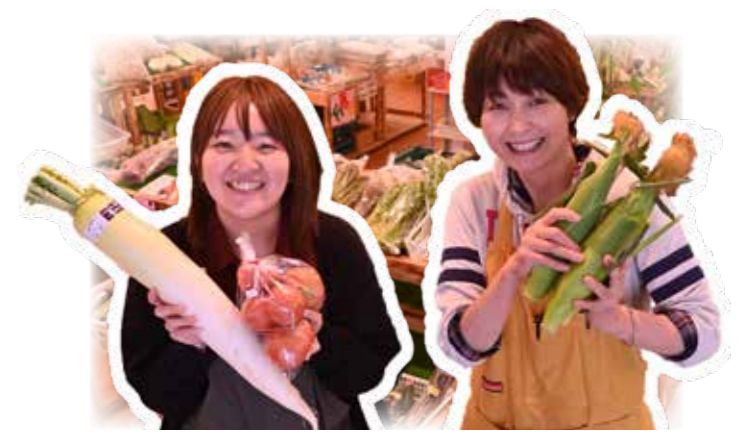
花き・野菜直売所「春那」さんのスタッフと地元で採れた野菜たち

「地元の野菜、どこで買えるの…」新鮮な地場産野菜は、農協店舗や町内の青果店、小売店などのほか、スーパーの一角などで販売されています。ここでは、農家さんが、その日の朝に収穫した新鮮な野菜を購入できる直売所をご紹介します。