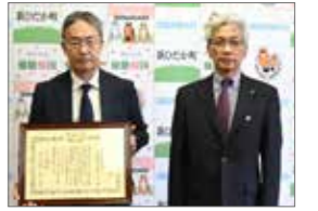
4月15日 池内建設(株)へ感謝状贈呈