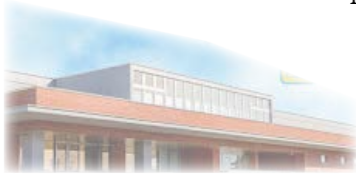
新ひだか町図書館