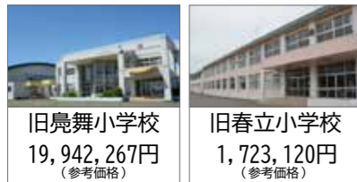
旧島舞小学校 19,942,267円 (参考価格) 旧春立小学校 1,723,120円 (参考価格)