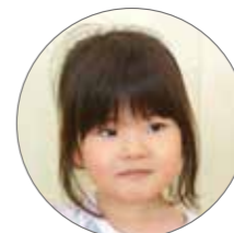
たんのあこちゃん(3歳)