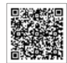
↑ QRコード 町公式ホームページ

①令和3年1月1日現在、町内に住所を有しない方が属する世帯 令和3年度非課税証明書(非課税の場合のみ、令和3年1月1日時点で住民登録をしている市町村で当該書類の取得ができます) ②令和2年分の収入申告をしていない方が属する世帯。(ただし、税法上の扶養親族になっている場合は除く)