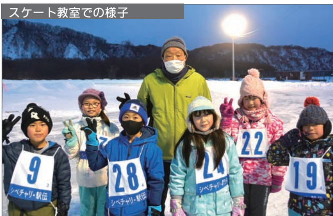
スケート教室での様子

また、妻とのウォーキングも日課となり、バードウォッチングを楽しんでいるほか、12歳の孫とのサッカーも楽しみの一つとなっています。