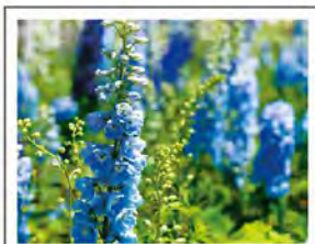
鮮やかなブルーのデルフィニウム