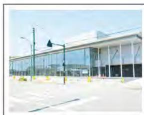
総合町民センターはまなす