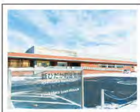
新ひだか町図書館・博物館