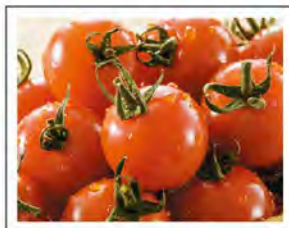
ミニトマト(太陽の瞳)