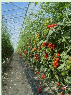
「就農1年目の太陽の瞳」