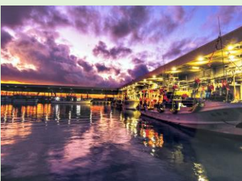
「夕日に染まる三石港」