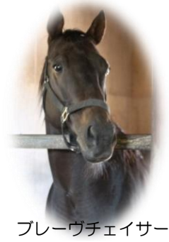
ブルーヴィチェイサー