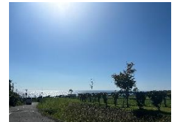
「自転車でくだりたい坂」