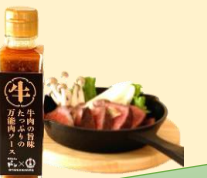
牛肉の旨味たっぷりの万能ソース

昆布を食べて育ったブランド黒毛和牛「こぶ黒」を原料に使った肉から生まれたお肉にかけられるお肉の万能ソースです。