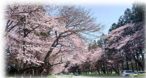
二十間道路桜並木