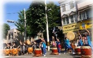
染退(しべちゃり)太鼓