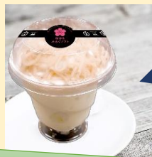
桜香るみるくソフト

令和4年度より、静内農業高校と新ひだか町の事業者が共同で考案したオンリーワン商品を開発中です！令和6年度は4事業者と共同開発中です。只今売り出されている商品はこちら↓↓