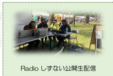
Radio しずない公開生配信