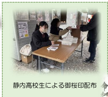
静内高校生による御桜印配布