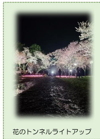
花のトンネルライトアップ