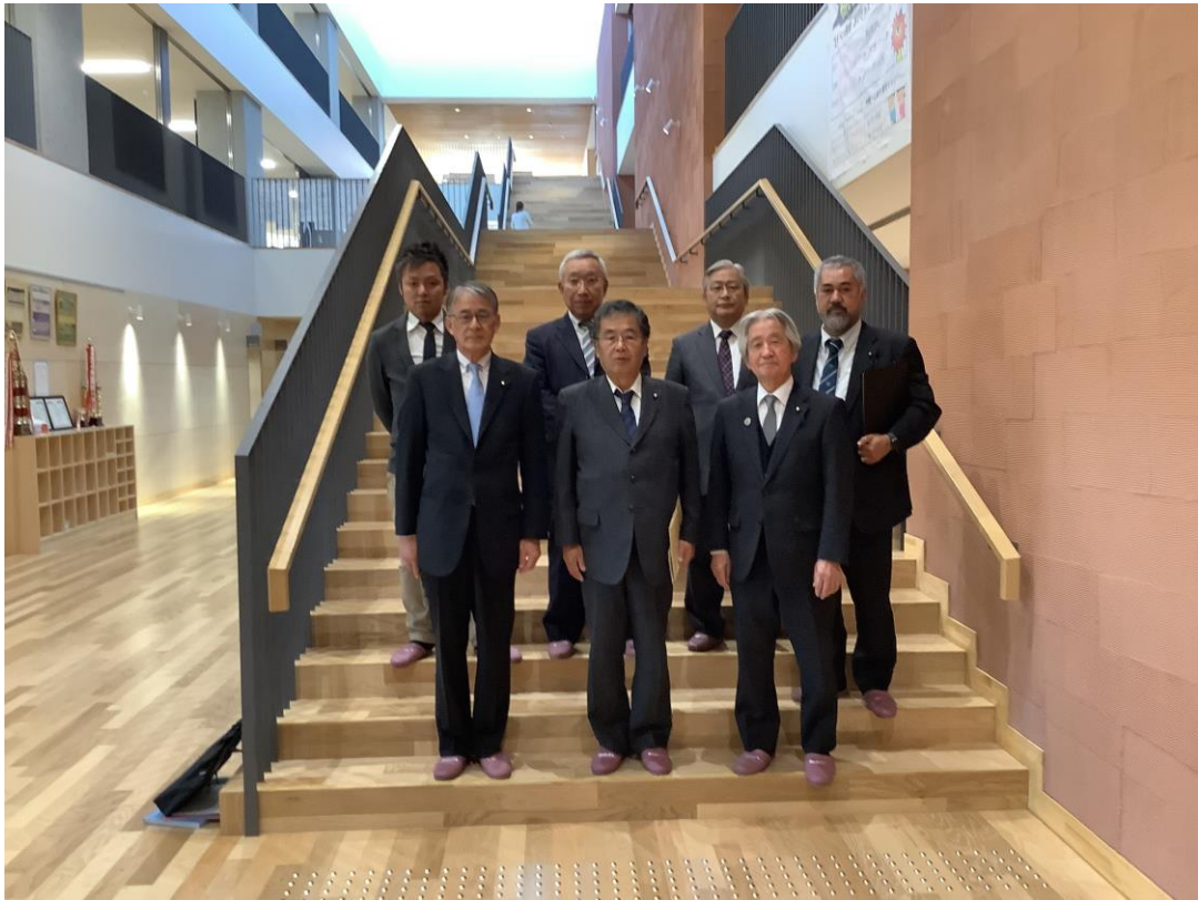
当別町立とうべつ学園にて当別町議会議長と