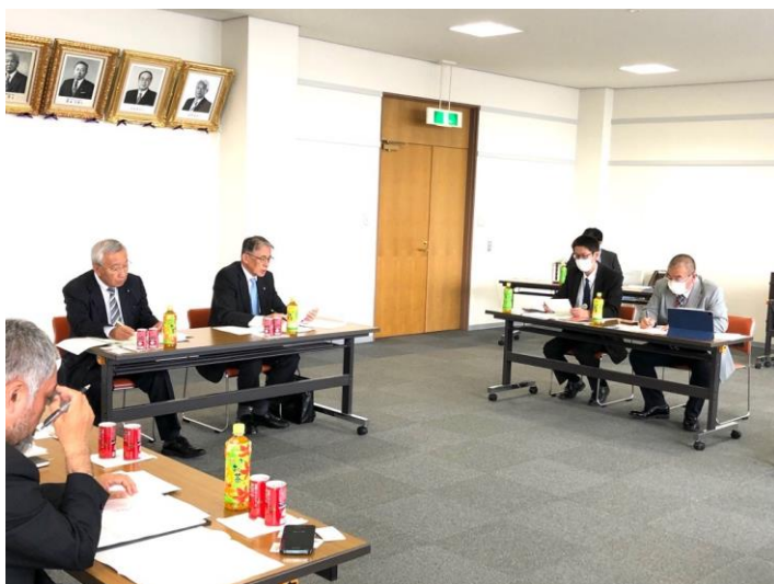
沼田町担当者より取組み状況を調査

気候は、内陸型で四季の区別がはっきりしており、自然を通して季節の変わりゆくさまを感じることができる。