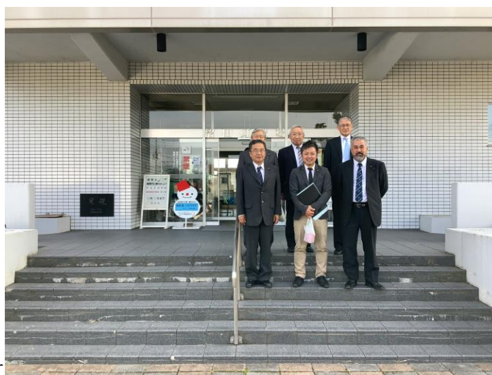
沼田町役場前にて