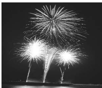
夏まつり花火大会

答（総務課長） 「新財政計画」では、財政の弾力性を示す「経常収支比率」、「実質公債費比率」、「将来負担比率」を指標としているが、「経常収支比率」はやや高め、他の2指標では問題はない。