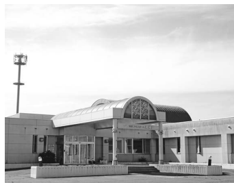
特別養護老人ホーム蓬莱荘

答 (健康推進課長) 高齢者福祉施設「静寿園」を除いて「蓬莱荘」では町直営の前年より10%減少、他の短期施設は「ケアハウスのぞみ」を除き稼働率は60%前後の稼働率。