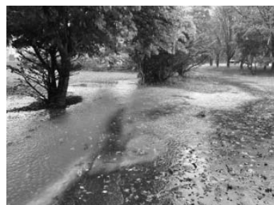
アイヌ民俗資料館前の浸水状況

問 町静内庁舎駐車場の駐車スペースは国土交通省の駐車指針に沿って設計されているか？正面の駐車場は狭く、駐車できても降りるのが大変だと多数の要望を聞いた。