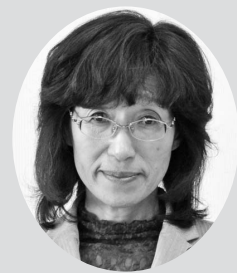
谷 園子 議員