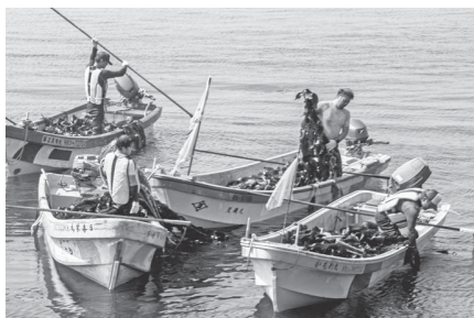
後継者にも期待がかかる

歳以上の組合員は50・4%も占めている。そのことから近い将来には高齢化による廃業にともない、漁業従事者の著しい減少が想定される。そのため漁業資源の維持増大や所得向上のための施策が重要であり、新規就業者を受け入れるための体制整備や関係団体との連携を図り、協議検討していきたい。