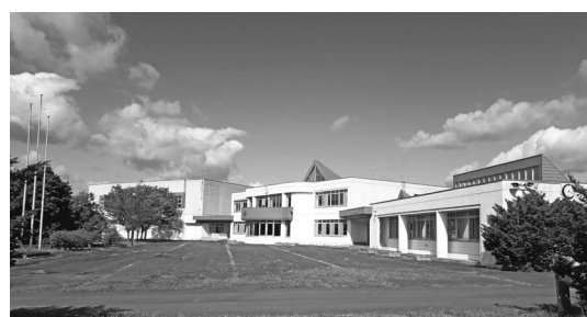
応募があった旧歌笛小