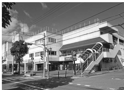
活用継続中のピュアプラザ

また、今後、活用応募が無い場合、取り壊し等将来の考えは。答(契約管財課長)2月より土地のみ有償で募集したところ、旧梟舞小、旧歌笛小に応募