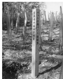
アオダモ植林状況

問 高規格幹線道路日高自動車道は、日高町厚賀IC（インターチェンジ）までの59・9kmは共用中である。現在は、事業名「厚賀静内道路ルート」16・2kmの厚賀側から工事整備実施中であり、その後、新ひだか町エリア内のルートも基本調査・測量・予備設計等にて計画を進められているが、町も含む関係機関との協議概要について伺う。 答 Cの位置については、町道第2原条山線と町道神森1号線との間に計画され、道道平取静内線に接続される計画となっている。各調査等の進捗状況は、昨年度までに基本調査・実測線測量・予備設計等が実施され、今年度は構造物設計や用地測量等が実施されている。 問 本事業の推進に関する町道接続等ハード事業費のアロケーション（費用負担）等があるのか、また、本事業に伴う新ひだか町都市計画マスタープランの見直し検討の考え方は。 答（企画課長）原則国の負担で施工することになるが、具体的な工法協議に入っていない段階である。高規格道路 が都市計画区域内に接続することで、都市交通・土地利用・都市環境に変化をふまえた見直しも含め、都市計画マスタープランの改訂作業を進めたい。