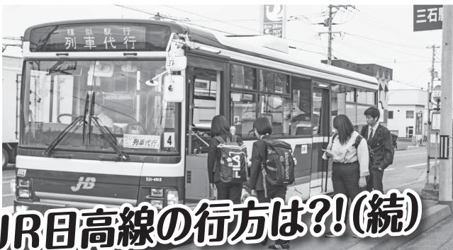
JR日高線の行方は?!(続)

ともかく、バス転換の場合、早急に地域のための利便性、よりよい交通体系を考え、議会に示すことを求めた。