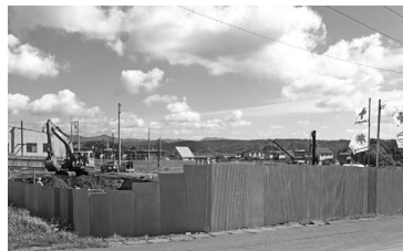
建築工事中の静内柏台団地

9月10日から13日までの4日間を会期とし、町民に見直し（案）をお知らせしていた使用料等の見直しに伴う関係条例整備に関する条例制定を中心に議案審議を行った。一般質問は、11名の議員が30項目のほか、補正予算、条例制定等、議案16件、報告1件、意見書3件を採択して13日に閉会した。