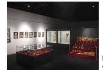
昨年の収蔵資料展の様子