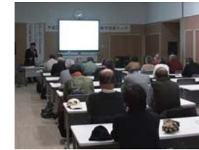
昨年の学芸員トークの様子