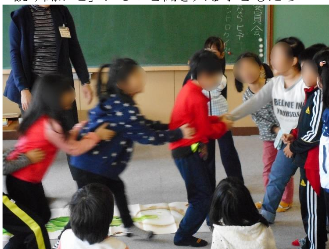
みんなの力を合わせての「大きなかぶ抜き」