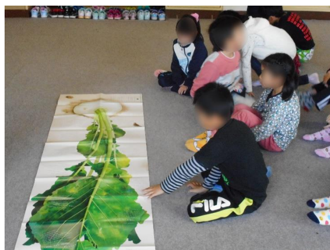
広げる本「大きなかぶ」に驚く子どもたち