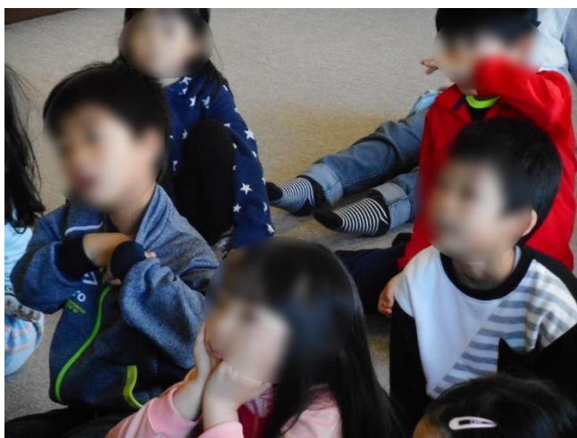
「読み聞かせ」にじっと聞き入る子どもたち