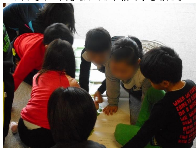
協力して、かぶに隠れた昆虫たち探し