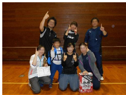
優勝した1年生チーム