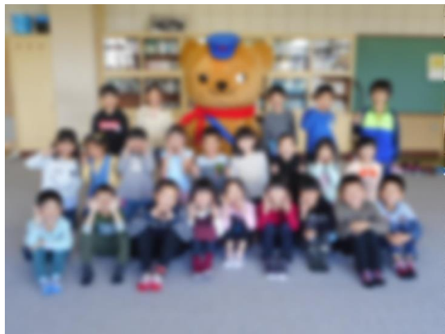
1年2組の子どもたちと“ぼすくまくん”