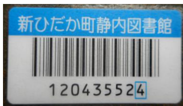
【このラベルが目印】

月に一度の返却日【右行事予定記載：「本馬くん家返却日」】に返却していない子がいます。各学級において指導を行っておりますが、ご家庭でもお子さんの本棚や机の上に本を見かけたら、声かけをお願いします。