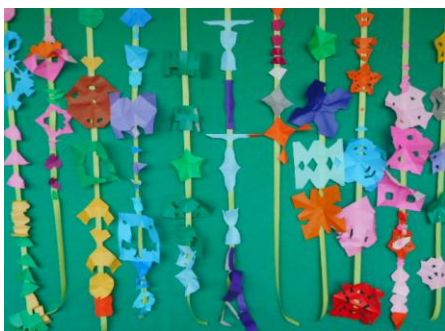
【1組：ちょきちよき作品】