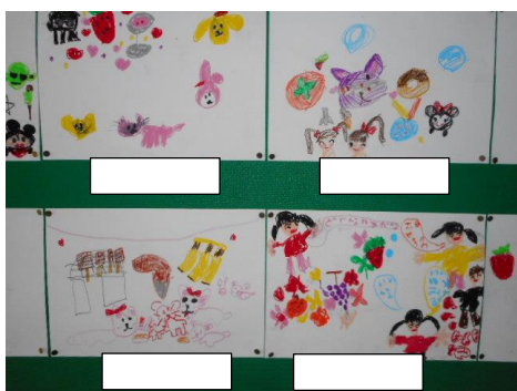
【2組：自分の好きなもの】